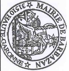
TABLEAU N° 2