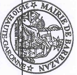
TABLEAU N° 1